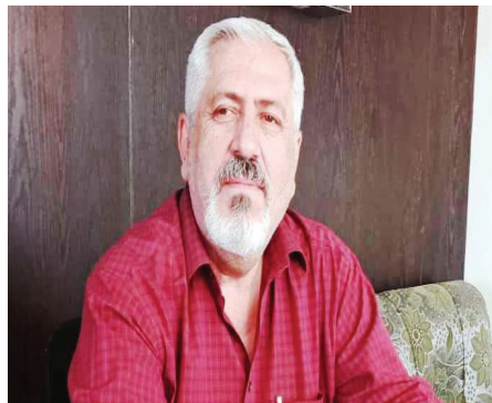
دجوار أحمد أفا

منذ الإعلان عن اعتقال (خطف) القائد والفكر الأبي الكبير عبد الله أوجلان في ١٥ شباط ١٩٩٩، وهناك سياسة خاصة تمارسها قوى الهيمنة العالمية والحداثة الرأسمالية بحق شعوب المنطقة وفي مقدمتها الشعب الكردي من خلال تطبيق سياسة العزلة والتخبئ وفق نظام خاص بجزيرة إمرالي بحق القائد عبد الله أوجلان، ٢٥ عاماً مضت على بدء تنفيذ المؤامرة الكونية التي انطلقت أولى خيوطها في التاسع من تشرين الأول عام ١٩٩٨ وهدفت إلى إخراج القائد من ساحة الشرق الأوسط ساحة المقاومة من خلال الضغط على النظام السوري والتهديد باجتياح البلاد الأمر الذي دفع للقائد إلى الخروج منها والتوجه إلى اليونان.