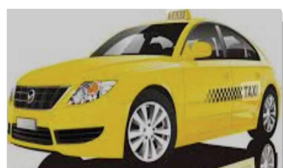
اعتماد الطلاء الأصفر في أغلب البلدان أصل كلمة تاكسي Taxi

الحسكة، آية محمد - تشتهر سيارات التاكسي في معظم أنحاء العالم باللون الأصفر. فهل تم اختيار هذا اللون عشوائياً. أم أن له قصة؛ فما قصة اللون الأصفر في تكاسي الأجرة؟