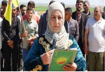
هدلة حاج مسلم

لكري سبي المشاركون في غرس الأشجار عن فرخهم واعتزازهم بشخصية القائد عبد الله أوجلان حيث قال المواطن أحمد إبراهيم: «نبار في هذا اليوم بغرس الأشجار بحماسة ذكرى ميلاد القائد عبد الله أوجلان، وهو أقل ما يكون عملاً لوقوفنا لتضحياته لأنه غرس في نفوسنا وقلوبنا الحب والأمل».