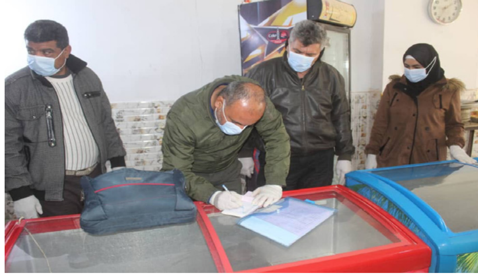
من قبل مسؤول القسم،

مركز الأخبار - تواصل بلدية الشعب في كركي لكي بتنفيذ أعمالها الخدمية اليومية التي تتنوع بين الحفاظ على نظافة المرافق العامة والجولات الرقابية الصحية، لأجل الحفاظ على نظافة المدينة وحماية الأهالي.