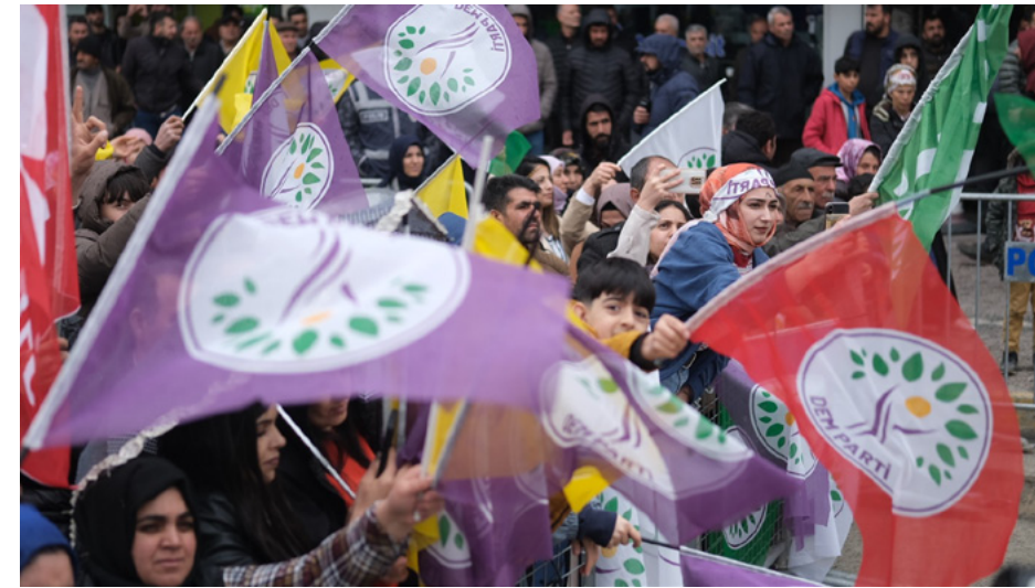
موقف الكرد بعد نتائج الانتخابات

الانتخابات شكّلت «نقطة تحول» لكنه وعد بإحترام قرار الأمة وتعهد بتصحيح الأوضاع في الدولة خاصة على المستوى الاقتصادي، ولكننا لا نثق في تصريحاته فهو دائماً يلفت من حولها ويكذب على مواطنيه، وعموماً