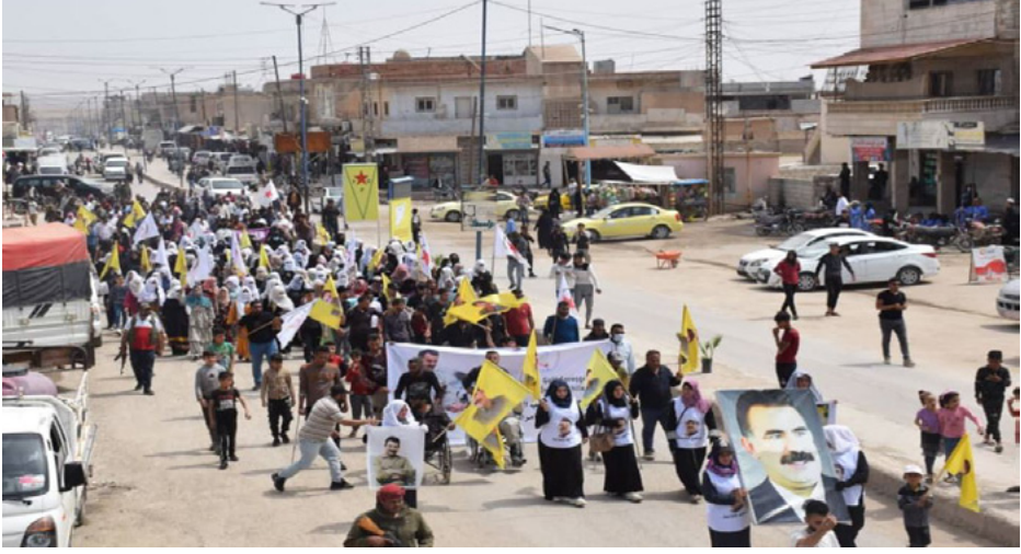
مناطق الدفاع المشروع بآشور كردستان

تواصل دولة الاحتلال التركي منذ منتصف نيسان الجاري عمليات القصف الخنفة، التي تستهدف بعل