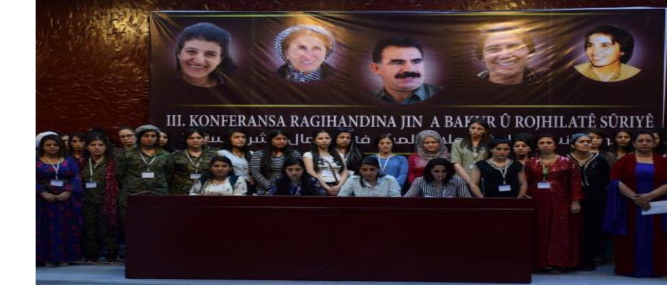
جلسة افتتاح مؤتمر «المرأة والإعلام» في مدينة هوار

عن حقوق الشعب الكردي، وهنا لا بد من الإشارة إلى جُربة الإعلام في إقليم شمال وشرق سوريا، تلك التجربة التي لعبت دوراً رئيساً لإيصال صوت هذه الثورة إلى شعوب المنطقة والعالم أجمع.