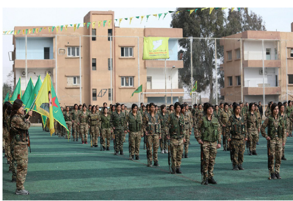
القائد عبد الله أوجلان مع جنود جيش تحرير المرأة في كردستان

أشار القائد عبد الله أوجلان إلى الأمراض الاجتماعية السائدة في المجتمع الأمر الذي لا بد من مواجهتها وعلاجها: «فيما يتعلق بحرية المرأة، فمعناها إيصال هذا الجنس،الذي ما زال يعاني من العبودية إلى مرحلة تتمكن فيها المرأة من اتخاذ القرارات، التي