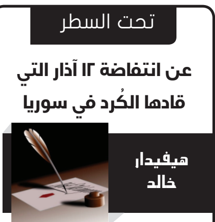
في ذكرى انتفاضة الـ ١٢ من آذار التي انطلقت شرارتها من

كون المرأة مظلومة من قبل الرجل فهذا واقع وحقيقة. وهو مفروض بالمتلق ولا بد من أن تُنصف المرأة وخُصل على حقها في الحرية. والسامح لأنها لم تُخلق لتكون حبيسة أربعة جدران. وأسيرة الأعراف والعادات البالية. من قتل وضرب وطلاق جائر. ولم تُخلق فقط لتموت وهي حيّة. ومن الواجب أن تعيش حياتها حرة كريمة وتتمتع بحياة هنيئة. ومناسبة اليوم العالي للمرأة الذي يصادف سنوياً الثامن من آذار نقول: لا نلطم الرجل للمرأة لأنها شريكة حياة. والتسمية الكردية للمرأة الزوجة (ههجين) تعتبر عن هذا الجانب بشكل جلي. ومن الطبيعي والواجب أن نطالب بتطبيق ذلك عملياً