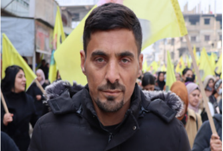
عبد الرحمن الكعود

قامشلو، علي خضير - أكد أهالي مقاطعة الجزيرة، أنّ القائد عبد الله أوجلان، بمقاومته وفكره، أفضل المؤامرة الدولية، التي مضى عليها ربع قرن، وأشاروا، إلى أن دولة الاحتلال التركي تمارس العزلة المشددة على القائد أوجلان، في انتهاك صارخ للقوانين الدولية والأخلاقية، وشدّدوا على مواصلة النضال والمقاومة حتى تحريره جسدياً.