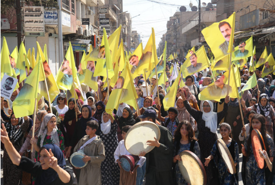
المضطهدة وخاصة الشعب الكردي.

النظام التركي يتندر بحجج وذرائع يعرفها القاصي والداني انها محض ادعاء وباطلة من أجل عدم تواصل القائد أوجلان مع الخارج. وكل هذه الأسباب والذرائع ليست قانونية ولا دستورية. ولا أساس لها من الصحة.