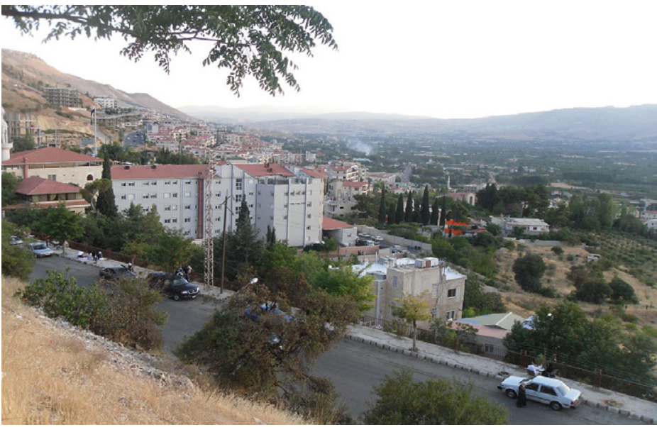
الوسطى في سوريا؟

السلطات التركية الخالية وخاصة وزارة العدل التابعة لأردوغان تمارس أفسس الانتهاكات والإجراءات التعسفية بحق القائد أوجلان. وكل ذلك يُنفَّذ ويطبَّق بتوجيهات وأوامر مباشرة من أردوغان. الذي طالما حاول محاصرة أفكار القائد الأبدية والفائدية والعنصرية بحقه وبحق الشعب الكردي عامة. فهو من يقف منذ زمن عناناً أمام حل القضية الكردية في تركيا وحتى الدول الأخرى. ويعرقل كافة مساعي الحل والسيارات الديمقراطية والمبادرات التي يطرحها الكرد والقائد أوجلان. بزعم أن الكرد يشكلون خطراً على أمنه القومي لينسب أي جهد لحوار عائته منذ أكثر من ثلاث سنوات. حتى خلال كارثة الرلازل التي تعرضت لها تركيا مطلع شباط العام الماضي مُنع من الاتصال مع ذويه رغم أن ذلك يُعدّ حقاً من حقوقه الطبيعية. وهذا الإجراء غير أخلاقي بحق القائد عبد الله أوجلان وذو خلفية أيديولوجية سياسية وفلسفية وتاريخية. إلا أن القائد ورغم كل ما تعرّض أفضل هذه المؤامرة وصقذ من مقاومته ضد سياسات المنظومة الدولية التي