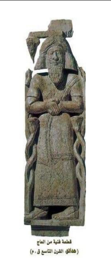
قطعة فخية من العاج (هلال القرن التاسع ق. م)

ليست أصلية، يعود تاريخ نشأة البلدة إلى ٣٠٠٠ق.م، وعاصرت فترة حكم الإمبراطورية الهيتية الحثية ١٦٠٠ عام قبل الميلاد، ليحكمها بعد ذلك الميتانيون والميديون، وبعدها الآشوريون والهيليونيون اليونانيون، حيث لهم فيها قصر.