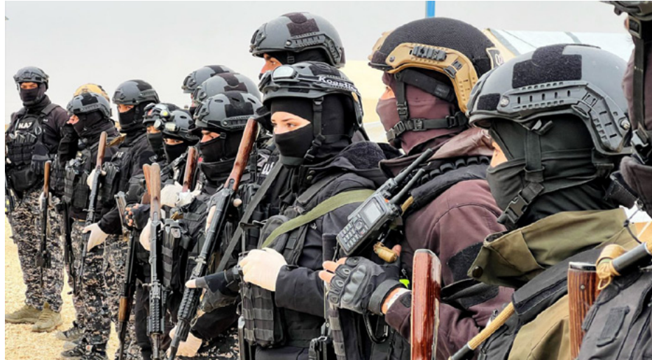
مقاتلو داعش في سوريا

روناهي، الدباسبية - رأى الباحث في الشؤون الكردية والتركية، محسن عوض الله، أن داعش ومرترقته موجودان في المنطقة ولم يتم القضاء عليهما إلى الآن، فكيف نتحدث عن إعادتهما وإيانهما من جديد، لأنهما ما يزالان يشكلان خطرا في المنطقة؛ وأشار إلى أن السبب في ذلك يعود إلى مصالح الدول الداعمة لمرترقة داعش، التي تقتضي استمراريتهم.