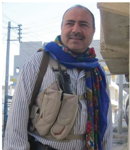
بكر حرج عيس

يحكى أن مدينة من مدن المقاومة اسمها كوباني، قد علّمت العالم معاني النصر والمقاومة، حدثت فيها مقاومة أحداثها شبيهة بالأفلام الخيالية، لكنها حقيقة عشناها مع الأيام الصعبة، عائلتي مكونة من ثلاثة صبيان، ذلك الوقت، أكبرهم كان يتجاوز الرابعة عشرة، وأصغرهم كان في التاسعة من عمره، توجهوا كبقية عوائل كوباني إلى باشور كردستان بعد دخول داعش أطراف المدينة.