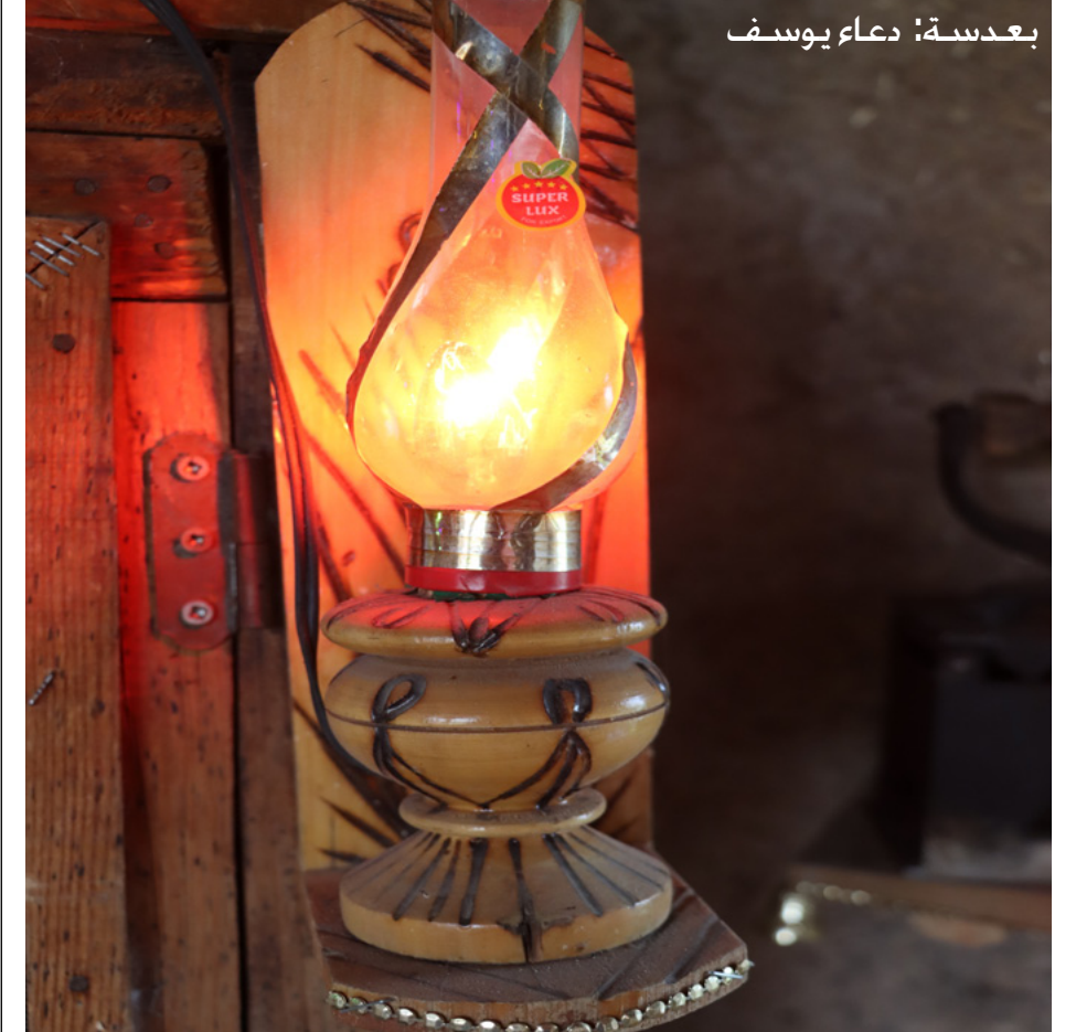
بعديّة: دعاء يوسف