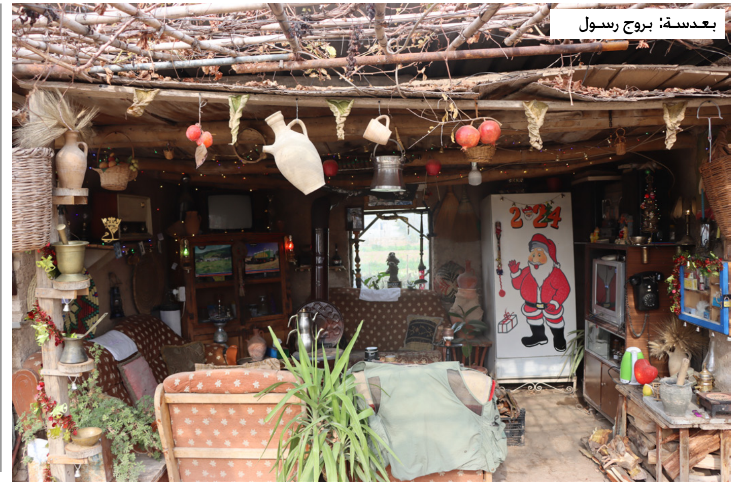
بعدها: بروج رسول

أُسست المجلة في الأول من كانون الثاني من عام ٢٠٢٣، وتُصدرت طبعاتها الأولى في ٢٤ أيار ٢٠٢٣، والمجلة تصدر كل شهرين متضمنة الجاور الهامة، التي خُمّلها الساحة الاجتماعية والسياسية في تلك المدة، والمجلة متنوعة من حيث المضمون، فهي فكرية سياسية، ثقافية، تتضمن كتابات وأشعاراً بأقلام نسائية من شمال وشرق سوريا، وكان الجور الأساسي للعدد حول «نظام الأمة الديمقراطية» ومفهومها