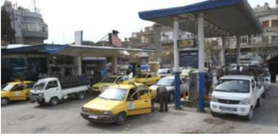
إعلاميَّة بوجود نقص في بعض أصناف

شهدت أسعار الوجبات السريعة ارتفاعاً ملحوظاً خلال الفترة الماضية، ما أدى لإعراض الأهالي عن ارتياد مطاعم الوجبات بشكل لافتٍ بسبب تزدٍ الأوضاع المعيشية وتراجع الدخل لدى الحذيين القاطنين ضمن مناطق سيطرة