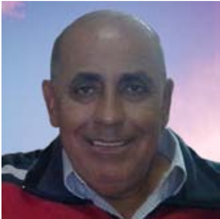
د علي أبو الخير

بعد شهر واحد يكون قد مضى ربع قرن من الزمان على اعتقال الزعيم عبد الله أوجلان وتمضي حملة الإفراج عنه ضد النظام التركي الأروغاني والمؤامرة الدولية الاستعمارية، ولكن التأمل لحياة القائد من وراء القضبان يجده يعيش في سلامٍ نفسي وسياحة روحية، ولم يحدث أنه طلب الإفراج عن نفسه أو قدم التماساً للقادة الأتراك على مر العقود، خاصةً في فترة حكم الرئيس أردوغان، ولكن محبيه وأحرار العالم هم من يطالبون بالإفراج عنه، والغريب أن القائد عبد الله أوجلان أنتج أفكاراً وكتباً ومفالات كثيرة، وثمينة، وهو قابع في سجنه، أي أنه يعيش في سلام هادئ مع نفسه.