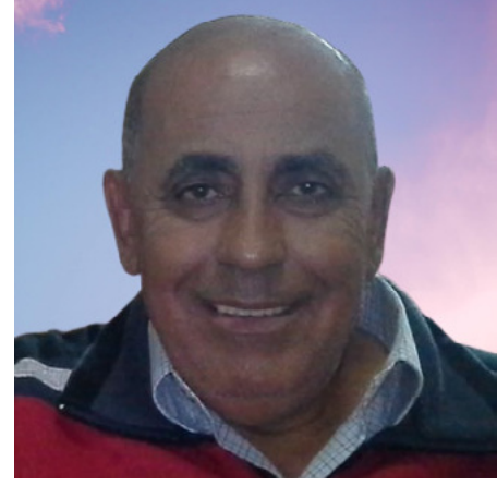
د علي أبو الغيزر

عن بعض البلاد كجنة الله كأرض مصر، إننا نصلي باستمرار في صلواتنا الخاصة، وأيضا في صلواتنا الكنسية لأن الكنيسة تعلمنا باستمرار أن نذكر رئيس الدولة في كل قداس ونذكر أيضا صحبه والعاملين معه، محبة الرئيس بالنسبة لنا عقيدة وأيضا علاقة شخصية.