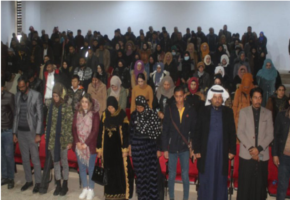
بقوله: «التطبيق العملي لأفكار القائد عبد الله أوجلان. سنحقق أهدافنا في الحرية والعدالة والمساواة والديمقراطية»

مركز الأخبار ـ أكد أهالي ناحية تل حميس التابعة لمقاطعة الجزيرة، على ضرورة قراءة مرافعات القائد عبد الله أوجلان لمعرفة الحقيقة التاريخية والثقافية للمجتمعات، وشددوا على زيادة الفعاليات لكسر العزلة وتحقيق حرية القائد الجسدية.