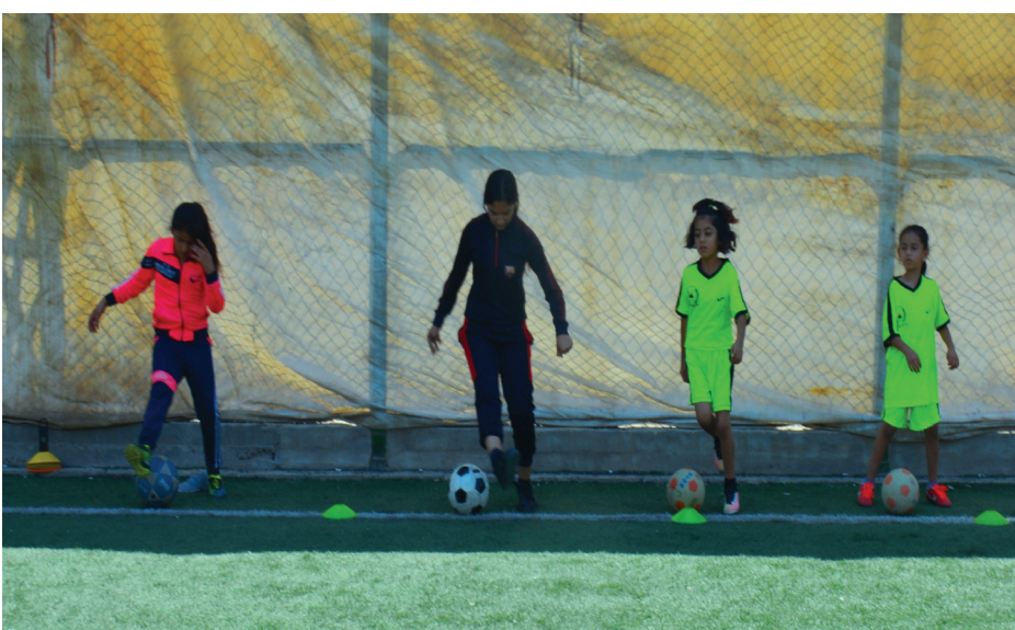
لاعبين يعلمون القوانين أكثرمن أكثرمن الكبار

قامشلو، جوان محمد - استنتجنا من خلال متابعتنا لمدارس لعبة كرة القدم، وتدريبات الأندية وبطولات الفئات العمرية لكلا الجنسين، إنه لجانب تعليم المهارات الكروية، يُتطلب من المدربين المشرفين على تدريب هذه الفئات تعليمهم القوانين والمعلومات الهامة عن لعبة كرة القدم، وذلك من خلال دروس نظرية وعملية، بسبب وجود من لا يعرف حتى الآن تنفيذ رمية التماس!