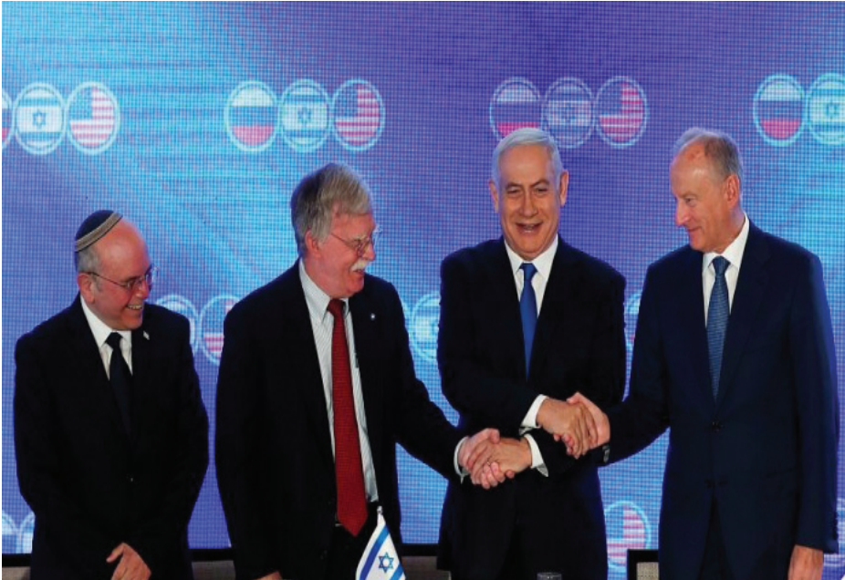
وزير الدفاع الإسرائيلي إيهود باراك

فُعل على توصيف الرئيس الأمريكيّ بوش دول إيران والعراق وكوريا الشماليّة، بـ"محور الشر"، لتلقف الإعلامُ الإيرانيّ المصطلح، واستخدمه على نطاق واسع في الخطاب