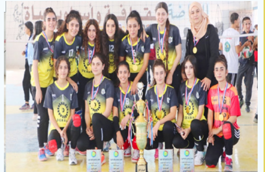
بعدة: أسماء مصطفى / الشهباء