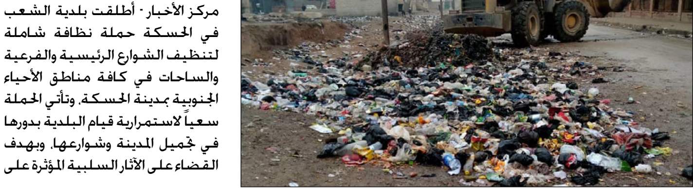
مركز الأخبار - أطلقت بلدية الشعب في الحسكة حملة نظافة شاملة لتنظيف الشوارع الرئيسية والفرعية والساحات في كافة مناطق الأحياء الجنوبية بمدينة الحسكة. وتأتي الحملة سعياً لاستمرارية قيام البلدية بدورها في جميل المدينة وشوارعها. ويهدف القضاء على الآثار السلبية المؤثرة على

٢- البدء بدورات تدريبية للجان المحلية ولجان التوريد وأمناء المستودعات والحاسبين. ٣- توحيد آلية عملية التوريد أثناء الموسم في مقاطعتي الجزيرة والفرات. ٤- تفعيل دائرة الجودة والرقابة الداخلية في الإدارة العامة. ٥- تشكيل لجان للإشراف على المخزون