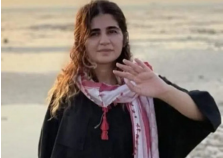
جميع في خطر