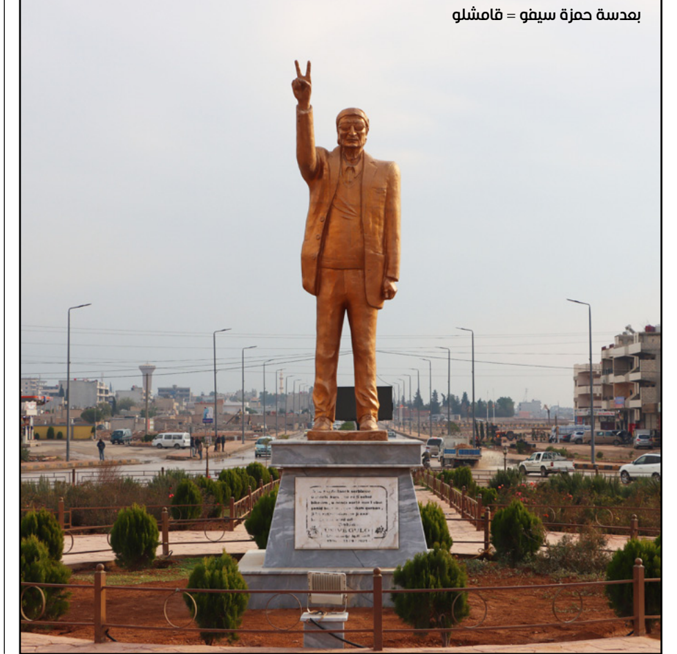
بدسة حمزة سببو = قامشلو

مراكز توزيع صحيفة روناهي واقتناء الكتب: إقليم الجزيرة- قامشلو (مكتبة سعدو- فرع (١) شارع ركي الأرسوي- جانب البلدية ٤٢٥٩٧- فرع (٢) شارع العام. مقابل جامع الشلاح ٤٥٢٠٨١/ مكتبة أواز- طريق عامودا ٤٣٩١٥٤/ مكتبة الحرية- الشارع العام ٤٢١٣٦٠/ مكتبة سومر- الشارع العام ٤٢٤٠٣٧/ مكتبة الراوي فرع (١) شارع الكورنيش. تجمع محلات الراوي ٤٤٤٠٢٨- فرع (٢) مقابل الصيدلية العمالية ٤٤٥٨٢٠/ مكتبة الزهراء- دوار البشيرة ٤٦٠٦٩٩/ مكتبة الجواهري ٤٤٣٧٤٢/ مكتبة دار القلم- الشارع العام ٤٥٧٢١٤/ مكتبة الأنوار شارع عامودا ٤٣٨٢٠٧. مكتبة الرسالة الشارع العام ٧٥٤٧٣٣-٧٥٤٧٣٣-٧٥٤٧٣٣/ درياسية (مكتبة سبأ ٧١١٤١٠) / جل آغا (مكتبة وائل ٧٥٥٥٥١) / تربه سببه (مكتبة الجهاد ٦١٨٠٤٧).