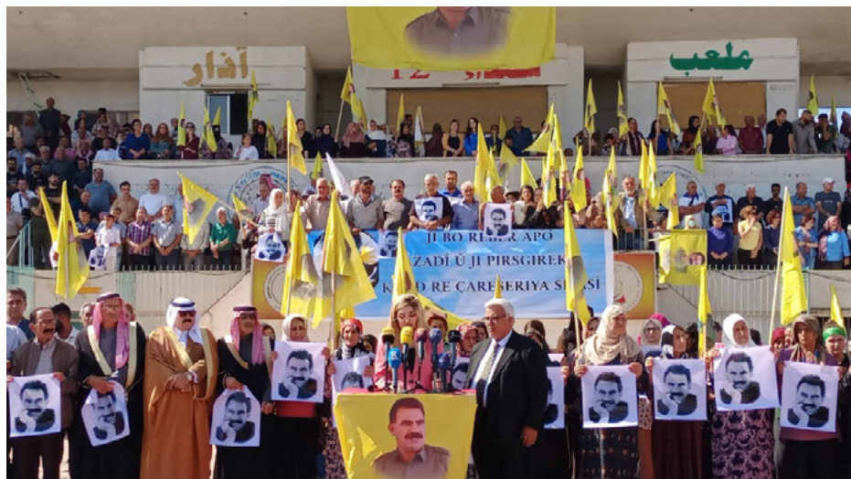
٢٢ تشرين الأول.

مركز الأخبار - أعلنت حركات وتنظيمات شعبية وسياسية ونسائية وشبابية وثقافية وفنية وأدبية، تأييدها للمبادرة التي حملت شعار "الحرية للقائد عبد الله أوجلان، الحل السياسي للقضية الكردية"، وذلك عبر أنشطة وفعاليات مختلفة على مستوى شمال وشرق سوريا.