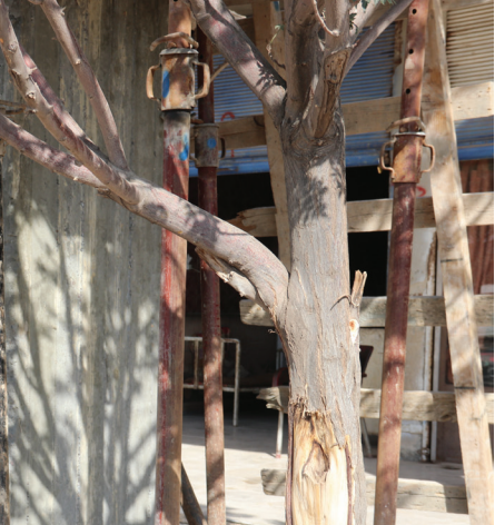
فاشية هذا القرن.