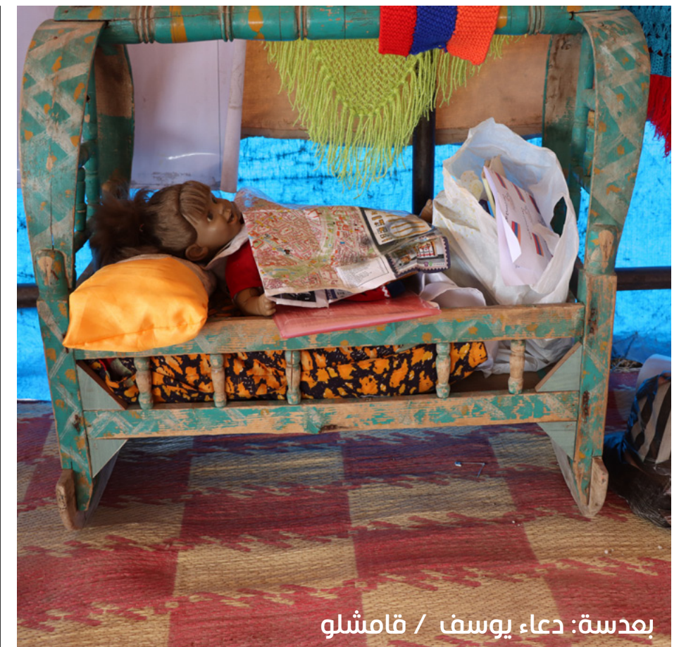
بعدهة: دعاء يوسف / قامشلو