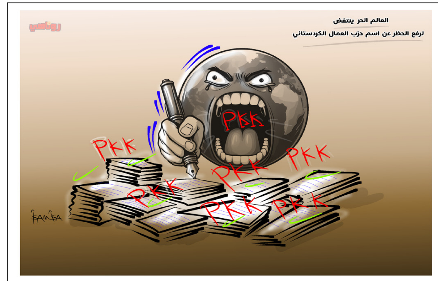
العالم الحر ينتفض لرفع الحظر عن اسم حزب العمال الكردستاني