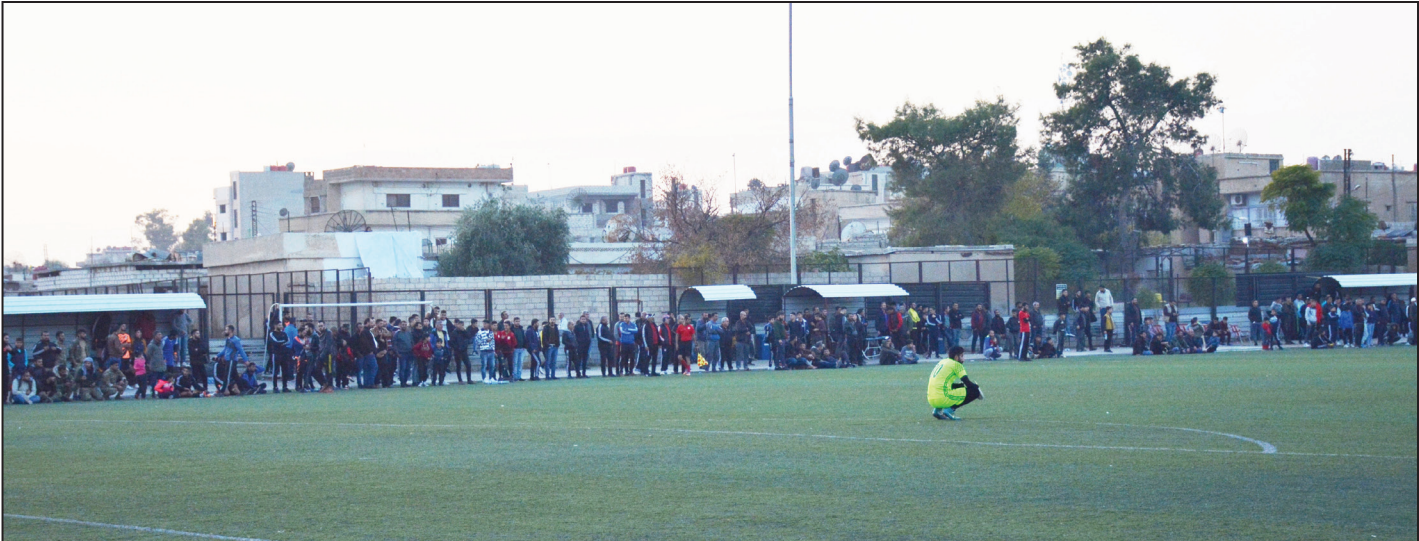
لاعبون في مباراة كرة القدم