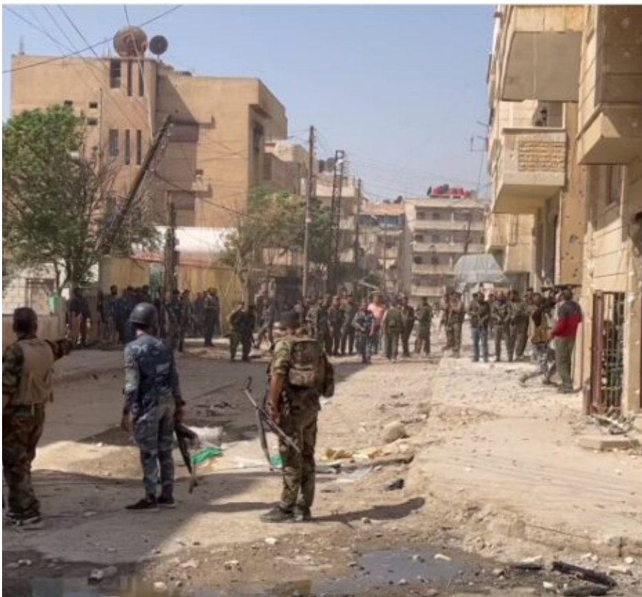
قوات سورية الديمقراطية في بلدة ديرالزور، سوريا.