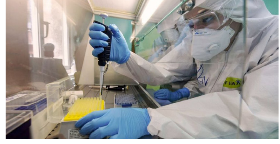
التطورية، التي أدت إلى ظهور متحور «أوميكرون» الشهير، في عدد التغييرات الجينية، القفزات

على الصعدين الوطني والدولي، يستمر العلماء في رصد هذا المتحور وخصائصه، وقد صنفت منظمة الصحة العالمية هذا المتحور بأنه «متغير قيد المراقبة». نظراً للعدد الكبير من التغييرات الجينية، التي يحملها، تشجيعاً للدول والباحثين على مشاركة تسلسلات الفيروس، والبيانات المتعلقة به، بهدف الإسهام في تحليله ومراقبته بشكل أفضل. تعكف مراكز الأوبئة والجهات الصحية العالمية على دراسة تأثير هذا المتحور الجديد، وقدرته على التحور والتأثير على التطورية، التي أدت إلى ظهور متحور «أوميكرون» الشهير.