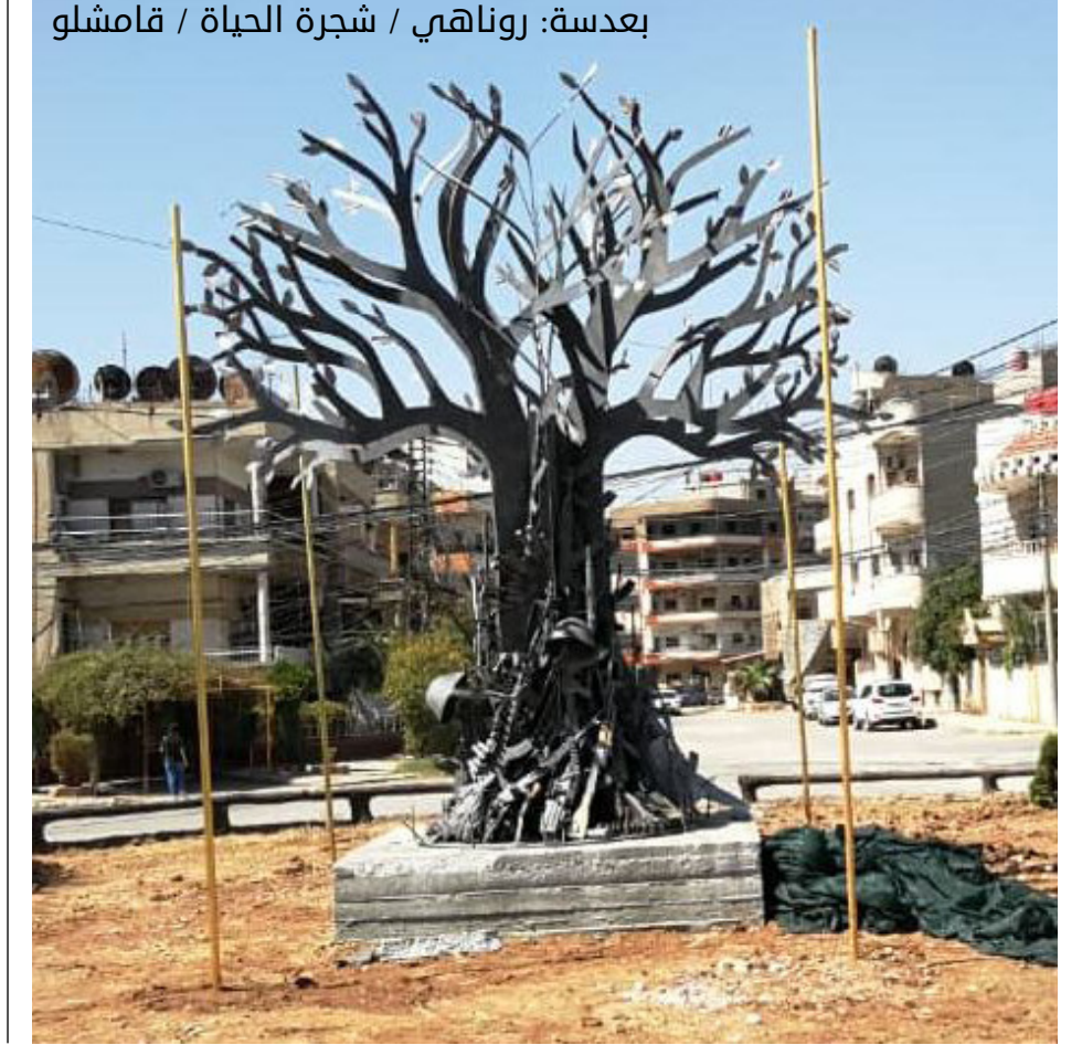
بعدها: روناهي / شجرة الحياة / قامشلو