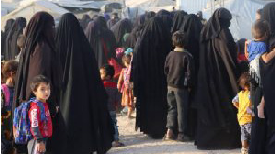
مناطق دوع الفرات الخاضعة لسيطرة الاحتلال التركي.