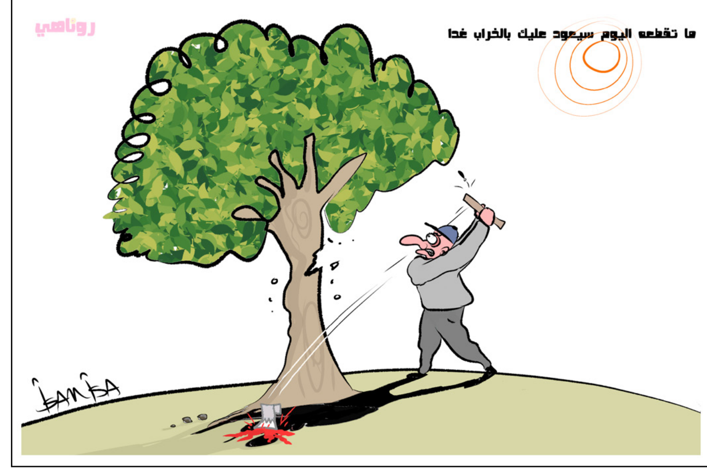
ما تقطعه اليوم سيعود عليك بالخراب غدا

يشهد العالم حالاً سباقاً علمياً مكثفاً لفهم ودراسة متحور جديد من فيروس كورونا، وهو المتحور المسماة «BA.1»، المعروف أيضاً باسم «Pirrola». يُقدَّر أنه يحمل أكثر من ٣٠ تغييراً في الأحماض الأمينية في البروتين الشوكي «سبايك»، وهو البروتين الذي يلعب دوراً أساسياً في دخول الفيروس إلى خلايا الإنسان. يتجه اهتمام العلماء نحو معرفة تأثير هذه التغييرات الجينية على فاعلية المناعة لدى الإنسان، وكذلك على تفشي العدوى، وقدرته على