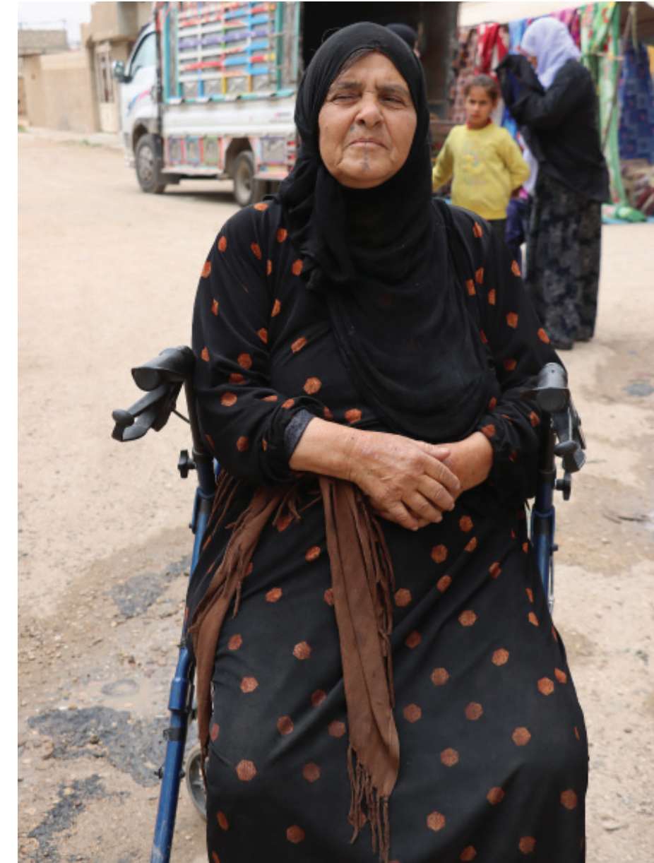
تعيدني للحياة. وتخرجني من كآبة منزلي الخالي من أولادي، وأحفادي الذين يأتون كل ستة مرة في زيارات رفع عتب

كانت حياة مريحة رغم تعبها، البعيدة سيراً على الأقدام، لتتجول بين البسطات، والعربات المحملة بالخضروات، والقطع المعروضة للبيع، تتفاوض في الأسعار، تجلس أمام كل بسطة لبضع الوقت. تتحدث مع صاحبها عن الحياة، وضعيتها، وعن جمال الحياة الريفية سابقاً وكيف كانت تجري في الحقول تطفف من خيراتنا، تتلفظ بضع كلمات عن حياتها سابقاً، بلغتها العامية: «ماكنت هيك كنت شبل عشر كيلوات ع ظهري بس هلق الكرسي هوي شاييني» التحسُّن عن يونس وحدتها اليوم تخرج فائزة إلى الأسواق الشعبية برفقة حفيدتها فهي لا تطيق الجلوس في المنزل. وبينت أن هذه الزيارة تعيدها للحياة القديمة، التي مازالت تربطها بها منذ القدم، وقد كان أصحابها يأتون إلى قرانا محملين بالبضائع المختلفة في السابق ضمن رحلات أسبوعية. وقد غرمت بها منذ أن كانت طفلة. وبعد الحادثة دخلت في مرحلة اكتئاب وكره للحياة. وعندما عدت لزيارتها عدت للحياة، ففيها الراحة التي اعتدت عليها في طفولتي وصباي».