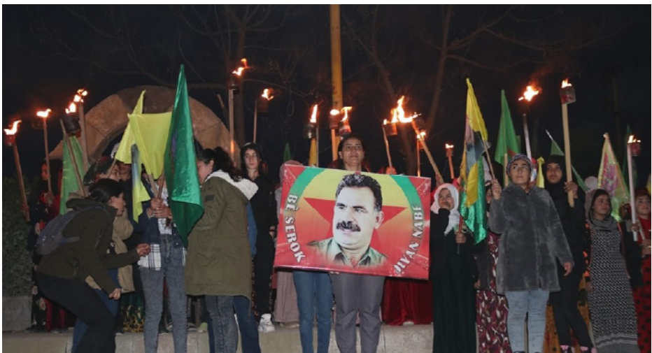
عبد الله أوجلان.

مركز الأخبار - تتصاعد ردود الأفعال المُنددة بالعزلة المفروضة على القائد عبد الله أوجلان تحت ما يسمى العقوبات الانضباطية منذ ال الخامس والعشرين من آذار عام 2021، وجدّدت الفاشيّة التركيّة مؤخراً حظر القائد من اللقّاء بعائلته ومهاميه لمدة ستة أشهر إضافية.