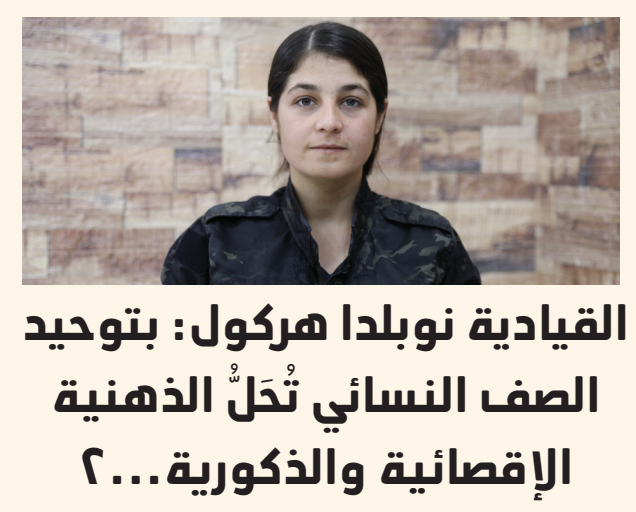
القيايدة نوبلدا هر كول: بتوحيد الصف النسائي تحل الذهنية الإقصائية والذكورية... ٢