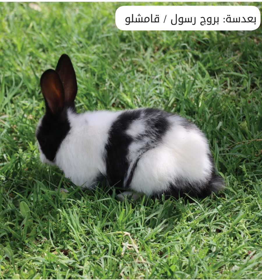
بعدها: بروج رسول / قامشلو