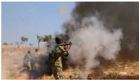
في أقاليم الشرق الأوسط، تهاجم قوات الاحتلال الإسرائيلي الفلسطينيين، وتتعمق قبضتها على الضفة الغربية، ودمشق، وريف حماه، وروباروك، ورام الله، والجنوب السوري.

مركز الأخبار - لا يزال التوتر الأمني يفرض نفسه في درعا بعد عدة حملات أمنية شنتها قوات حكومة دمشق، والفرقة الرابعة بتوجيهه، ولا سيما بعد مشاركته في اقتحام المنطقة الغربية بدرعا. خلال عام ألفين وواحد وعشرين.