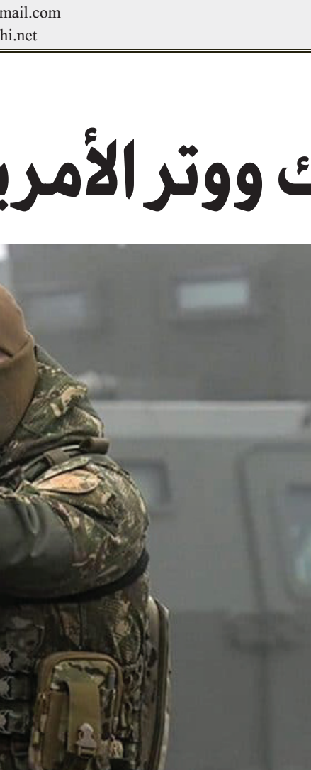
بلاك ووتر الأمريكية

كان ومازال الغرب الأمريكي والأوروبي يأمل في حرب أهليّة روسيّة. بل أعادوا للأذهان موقف روسيا في الحرب العالميّة الأولى. التي ظهرت خلالها