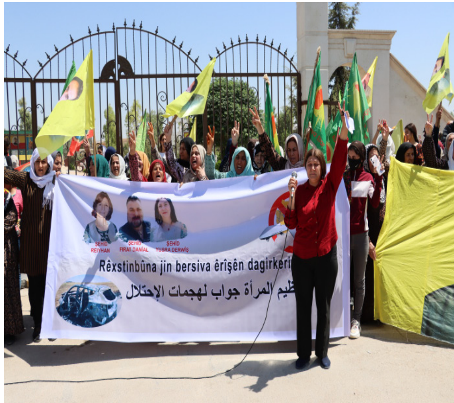
واشو كاني بمظاهرة يوم السبت في الرابع والعشرين من شهر حزيران الجاري، تنديداً بهجمات الاحتلال التركي الفاشي على مناطق شمال وشرق سوريا.

قامشلو، علي خضير - تحت شعار "تنظيم المرأة جواب لهجمات الاحتلال" وتنديداً بالهجمات التركيّة على مناطق شمال وشرق سوريا، ولا سيما الاعتداء الأخير الذي استشهدت إثره إداريات لمقاطعة قامشلو، نظم مؤتمر ستار في مدينة قامشلو مظاهرة شعبية في حي العنترية، الأحد 25_6_2023.