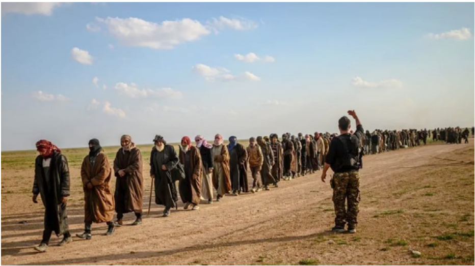
بعد تحرير مناطق شمال وشرق سوريا من مرتزقة داعش، اعتقلت قوات سوريا الديمقراطية الآلاف من عناصر مرتزقة

مركز الأخبار - طالب أهالي دير الزور بضرورة محاسبة مُعتقلي داعش ومحاكمتهم في أقرب وقتٍ، ومحاسبة كل من يقوم بدعمهم، وأكدوا أن خطر داعش لا يزال موجوداً في ظلّ الهجمات التركيّة المُتكررة على المنطقة.