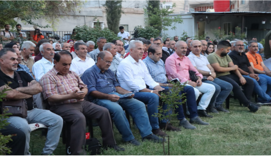
مهرجان القصة الكردية الثامن في قامشلو

المهرجان يُنظمه اتحاد كتّاب الكرد - سوريا. وبمشاركة ٢١ قاصاً وقاصة. وكان للمهرجان قد افتُتح مساء الثلاثاء ٢٠٢٣-٢٠٢٢. وختت عنوانÇirok