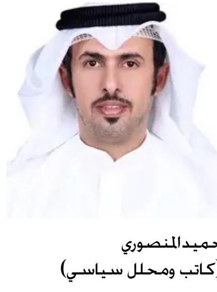
حميد المنصوري (كاتب ومحلل سياسي)

علم الأيكولوجيا المتعلق بالتفاعلات والمؤثرات المتبادلة بين جميع عناصر النظام الأيكولوجي من النباتات والحيوانات والتربة والماء والبشر والعوامل الجوية والزمان والجزء الثاني من التعريف. يشمل ما يقوم به البشر من تفاعل وسلوك ومنشآت وعلوم مؤثرة على الطبيعة والبيئة.