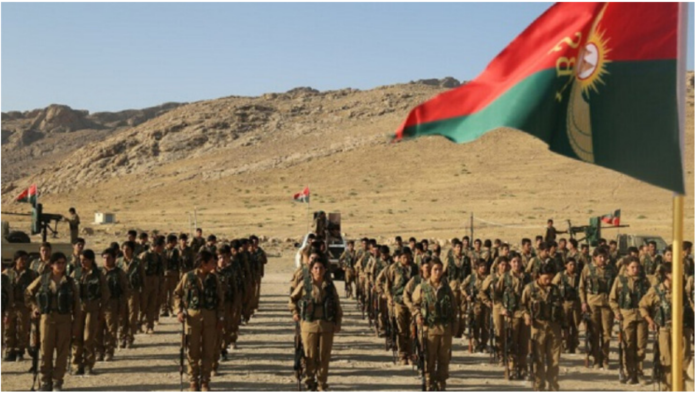
جنود كردية يمشون في ساحة في الموصل.