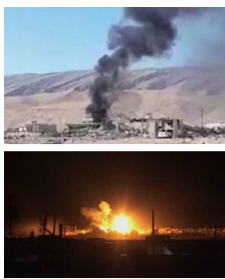
استهداف للضامن والوحدة المحففة عبيدي إلى مساعي أردوغان من هذا

نتيجة فشل دولة الاحتلال التركي بربها؛ حرب الإبادة الجماعية ضد نهم الحرية والديمقراطية في سادات المقاومة، تلجأ دولة الاحتلال إلى استخدام جميع الأساليب والأدوات حتى الفدحة والخارقة للقوانين الدولية لإبقاء سلطتها الاستبدادية، وما الهجوم على المطار الدولي في السليمانية إلا حرب معلنة بالنهم نفسه ضد الكرد.