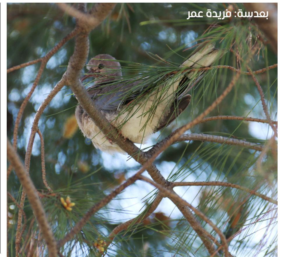
بعسدة، فريدة عمر