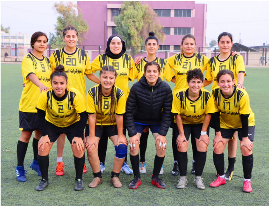
مباراة سيدات الهلال وعامودا ستفام يوم الثلاثاء ٢٨/٣/٢٠٢٢، على أرضية عشرةظهرًا.

روناهي، قامشلو ـ حققت سيدات نادي عامودا لكرة القدم فوزاً كبيراً على سيدات الجهاد من قامشلو، بنتيجة عشرة أهداف دون رد، وليكويّل الطريق في الوصافة ومطاردتهن لسيدات فيروزة المُتصدرات للدوري واللواتي فنّزْنَ على سيدات العربي بهدفين دون رد.