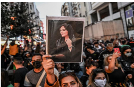
البحر قبل ذلك.

وأشار: إلى أنه ستصعد المناجر في ساحات البرلمان التي تحولت إلى ساحات للحرّة، بأن شرطهم الأساسي هو ديمقراطية تركيا، وأن تسود الحرّة والديمقراطية في أمد، متمنياً حرية الشعب الكردي وكردستان وقائدنا.