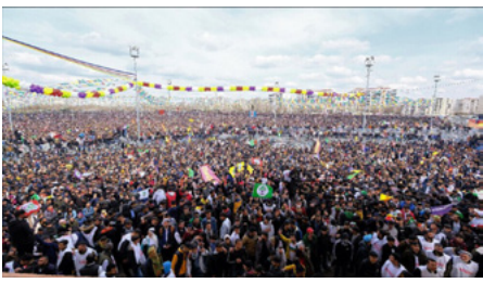
نوروز سلام ومساواة ووطن حرة.

وأشار أنهم يعلمون بأن هذا النموذج يتعرض للضغوطات، نحن نرى أن مشروع