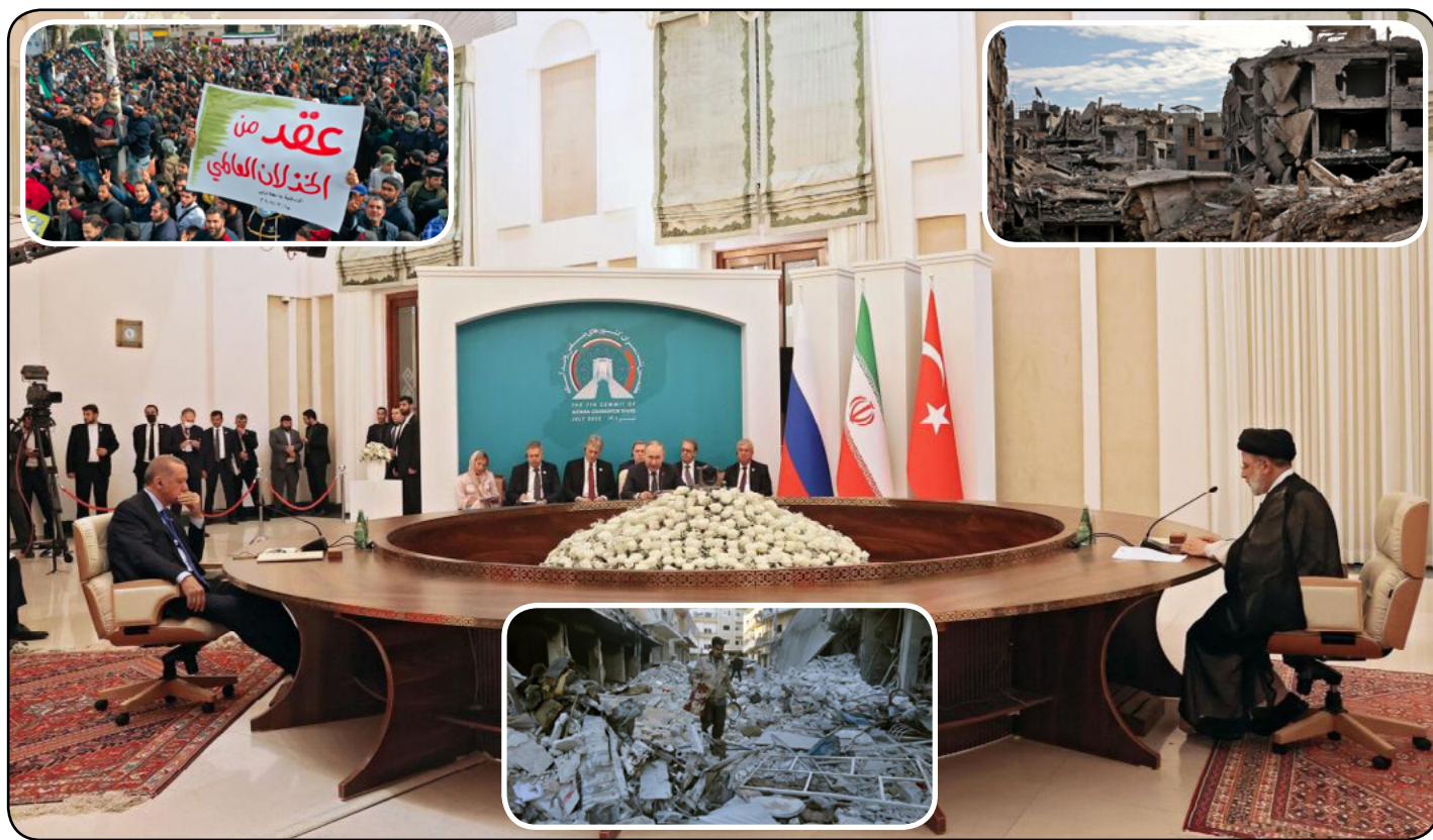
الحوار معاً كسوريين.

في مواجهة طهران وموسكو معاً في أي تفاهات بالمستقبل، وبالتالي ربما فضلت الاجتماع مباشرة مع دمشق من جهة، ومن جهة أخرى، فتركيا لا تنظر إلى أي نفوذ إيراني بارتياح ولديها خشية من امتداد النفوذ الشيعي إلى أراضيها. ولكنها لا تستطيع الاستغناء عن إيران؛ كونها الطرف الأكثر وصاية وسيطرة على قرار رئيس حكومة دمشق.