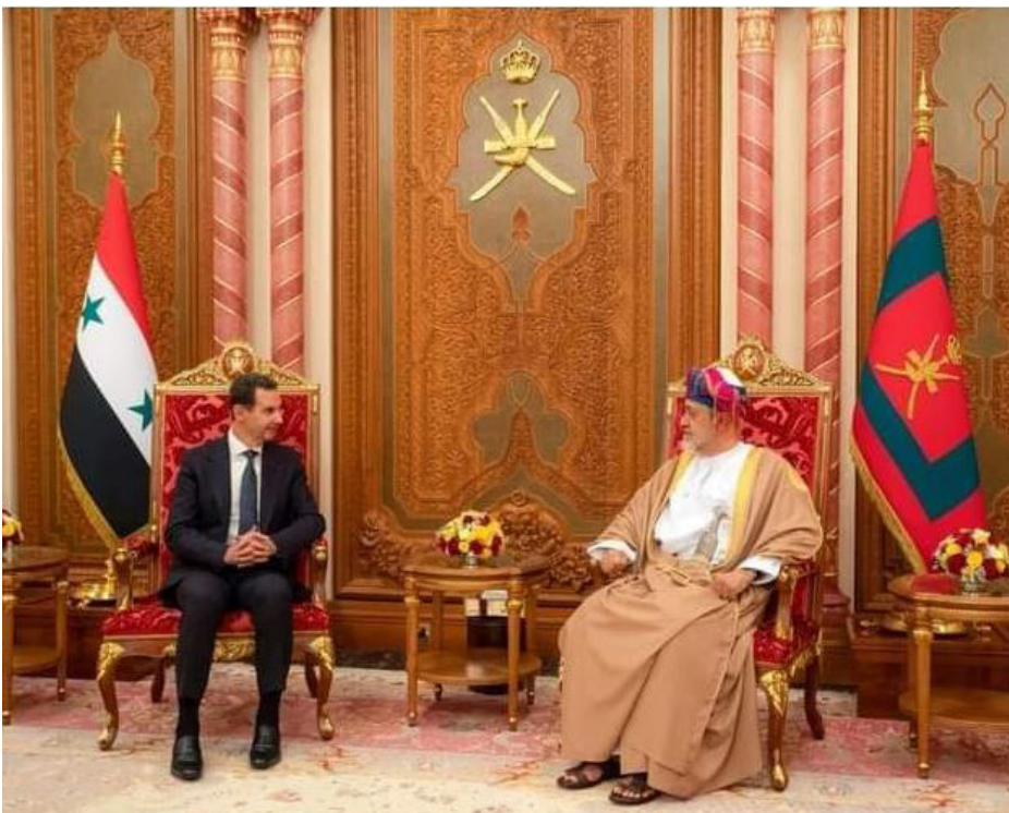
تعزيز عربي في مواجهة النفوذ الإيراني

تتوافق ملامح مقاربة عربية جديدة إلى سوريا بعد الكارثة الإنسانية، التي ألمت بالشعب السوري إثر زلزال السادس من شباط، في مساجٍ واضحة لإعادة حكومة دمشق إلى الحزن العربي، وعودة إلى المحيط العربي مشروطة بعيدا عن إيران.