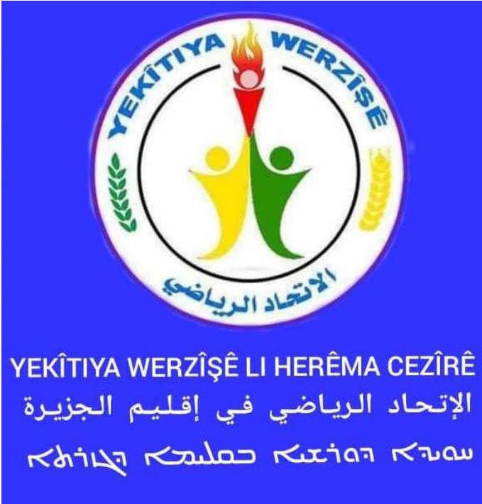
الاتحاد الرياضي في إقليم الجزيرة

وبدأت مختلف الأخادات في شمال وشرق سوريا بتنظيم بطولات للألعاب الفرديّة بهدف انتقاء منتخبات