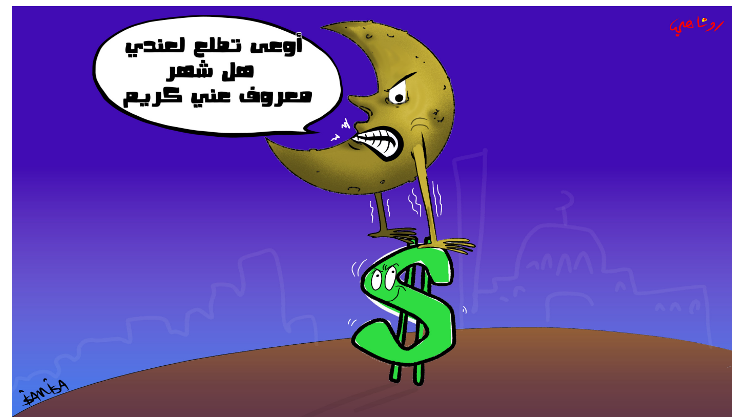
أوعى تطلع لعندي هل شعر معروف عني كريم