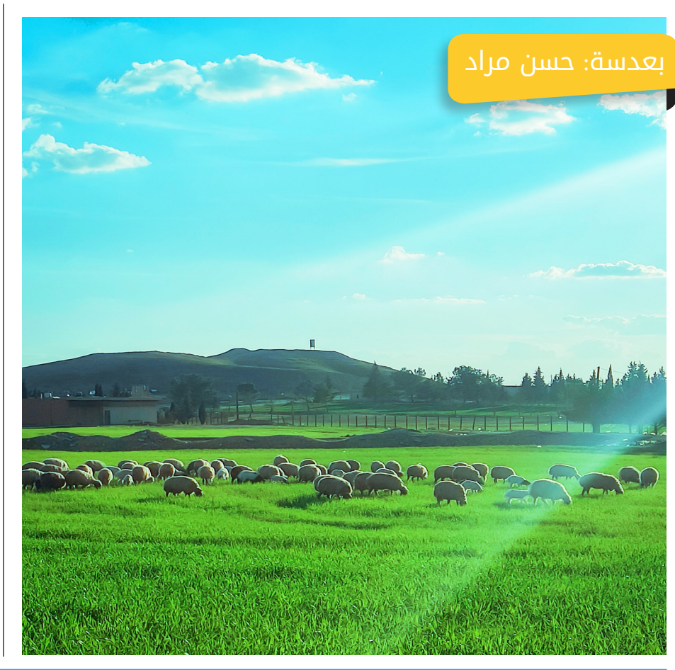
بعدة: حسن مراد