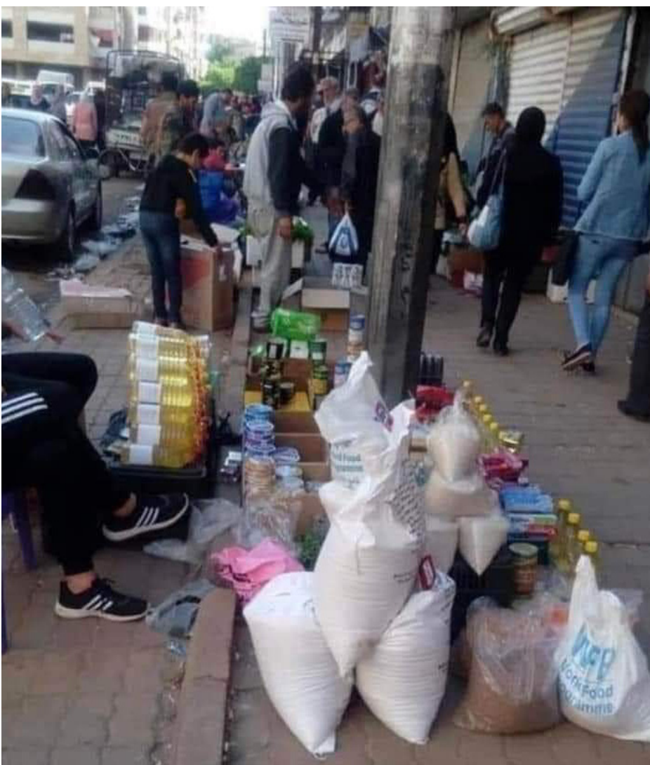
سارق في سوق حلب

وقامت أيضاً السلطات في حكومة دمشق بمعايات اعتقال بعض