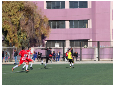
وبسبب التأجيلات التي تطال دوري هاتين الفئتين قرر مكتب كرة القدم في الاتحاد الرياضي بإقليم الجزيرة بتكثيف المباريات في الوقت الحالي. والمحاولة لإنهاء مرحلتي الذهاب والإياب قبل حلول شهر رمضان المبارك، والذي من المفترض أن يكون بتاريخ ٢٣/٢٠٢٣.

روناهي، قامشلو - تأجلت منافسات الجولة الثانية ذهاباً من دوري الأشبال والناشئين لكرة القدم في إقليم الجزيرة، لمرتين، الأولى كانت بسبب برودة الطقس والهطولات الثلجية والمطرية في المنطقة، والثانية بسبب الزلزال المُدمر الذي ضرب معظم المدن في سوريا، ولتعود عجلة الدوري للفتين مؤخراً للدوران مجدداً.