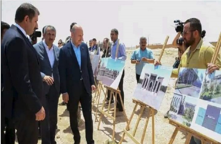
وزير التعليم العالي والبحث العلمي، الدكتور خالد خورشيد،

وعلى غرار منطقة عقربين وغيرها من التي تخلتها تركيا (الباب – جرابلس – اعزاز، إلخ) يمضي الاحتلال التركي قداماً في تتريك منطقة كري سبي/تل