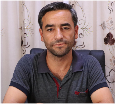
صيانة الخزان بتكلفة عالية

ألف نسمة في ١٨ قرية بريف كوياني الغربي، وأوضح إلى أن الزلزال المدمر تسبب بانشقاقات كبيرة في جسم الخزان وميلانه؛ ما أدى إلى تسرب كبير للمياه في جدرانهِ، وأرضيته،