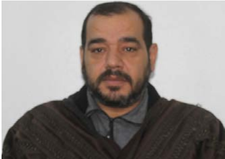
السعي لتوفير الأدوية

الطبقة، ماهر زكريا . سياسة احتلالية جديدة تتبعها دولة الاحتلال التركي بحق شعوب شمال وشرق سوريا وهي منع دخول أدوية الأمراض المزمنة عبر المعابر الحدودية إلى المنطقة في مساعيها لإبادة شعوب المنطقة بشتى الوسائل.