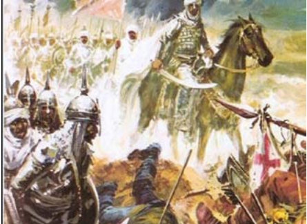
واليا على إفريقيا.

يعدّ أبو سعيد عبدَ الرحمن بن عبد الله بن بشر بن الصّامر الغَافقيّ العَكرّيّ من أبرز الفَاحِثين، فهو ينتمي إلى قبيلة (غافق) وهي من فروع قبيلة (عك) التهامية اليمنية، وهو من التابعين المشهور لهم بالعدل، والأخلاق وكثرة الجهاد، وكان له دور هام في رآب الصدع بين قبائل العرب (للضرية واليمينية)، والعرب المضربة بيسمون أيضا الفيسية والعدنانية وهم عرب الشمال، أو العرب المستعربة، نسبة للنبي إسماعيل عليه السلام، وكانت لغتهم السريانية قبل التحول للعربية، أما القبائل اليمنية ويسمون أيضا القحطانية، وهم العرب العاربة، ذوو الأصول الغربية الأصيلية وأصلهم من اليمن، ولغتهم العربية الساباق، من تبعية الأندلس، وتعيين ولاتها من قبل ولاة إفريقيا، فيما عين إسماعيل بن عبيد الله بن أبي المهاجر