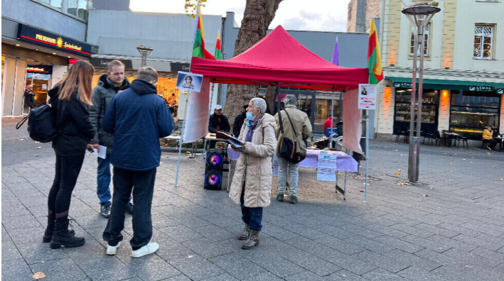
اتحاد الإعلام الحر

وتم توجيه دعوة في الفعالية، للمشاركة في المسيرة التي ستقام في دوسلدورف بألمانيا يوم ٢٥ تشرين الثاني، في يوم الدعم ومكافحة العنف ضد المرأة.